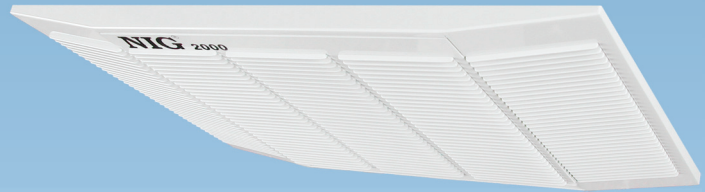
NIG ® 2000

เป็นเครื่องฟอกอากาศที่มีรูปทรงสวยงามสามารถตั้งโต๊ะเคลื่อนย้ายได้ ติดตั้งแขวนผนัง แขวนเพดาน หรือติดตั้งฝังในฝ้าเพดานได้สวยงาม เครื่องเดินเรียบ ไร้เสียงรบกวน กินไฟน้อย ดูดอากาศเสียเข้า 1 ช่องด้านหน้าและฟอกอากาศดีออกจากตัวเครื่องได้ 2 ทิศทาง ขจัดมลพิษต่างๆได้ดี เสริมสร้างอากาศให้สะอาดบริสุทธิ์ ทั้งส่วนตัวและส่วนรวม เหมาะสำหรับใช้งานในห้องประชุม ห้องทำงาน และโรงพยาบาล ควบคุมการทำงานระยะไกลด้วย Remote Control